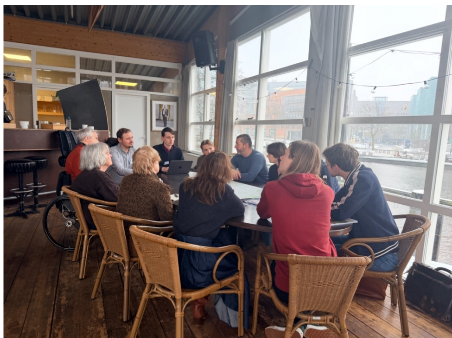
Een gesprekstafel tijdens de stakeholderbijeenkomst Diepenring

Hoe dit vervolgtraject precies wordt ingericht, wordt later dit jaar nader bepaald, binnen de kaders en richting die het bestuur en de gemeenteraad meegeven. In die fase wordt verkend hoe de inzichten uit de onderzoeksatlas kunnen worden vertaald naar mogelijke ontwikkelrichtingen en toekomstbeelden voor de Diepenring. Ook in het vervolg blijft de dialoog met de stad belangrijk. De onderzoeksatlas fungeert daarbij als gedeelde basis om het gesprek over de toekomst van de Diepenring te blijven voeren.