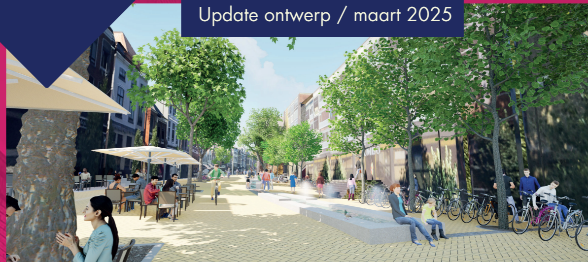
Impressie Oosterstraat (geen definitief ontwerp)