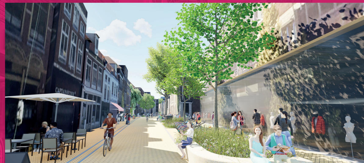
Impressie Gelkingestraat (geen definitief ontwerp)

De Oosterstraat en Gelkingestraat zijn belangrijke routes van en naar de Grote Markt. Dagelijks maken veel voetgangers en fietsers gebruik van deze routes. Sinds de zomer van 2022 rijden er geen bussen meer door deze straten, waardoor ruimte ontstaat voor een nieuwe inrichting. Dit biedt kansen om de straten prettiger en groener te maken voor voetgangers, fietsers, bewoners en ondernemers. Fietsers kunnen straks in twee richtingen door de straten fietsen en er komt ruimte voor groen en zitplekken. Ook worden de aansluitingen met omliggende straten verbeterd.